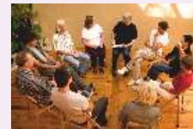
Atención psico familiar grupal