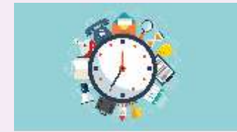
Gestión del tiempo