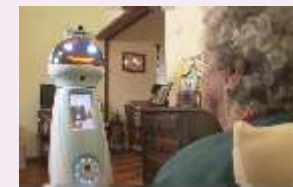
Aprovechamiento de las nuevas tecnologías para cuidador@s