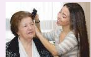
El mayor en la familia, pautas de convivencia.