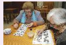
Talleres de envejecimiento activo para mayores