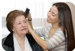
El mayor en la familia, pautas de convivencia