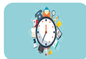
Gestión del tiempo