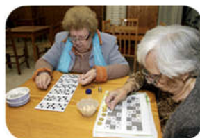
Talleres de envejecimiento activo para mayores

Octubre- Diciembre Días: martes y miércoles martes y jueves