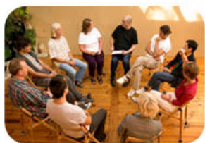
Atención psicofamiliar grupal